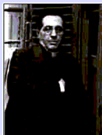
Don Giuseppe De Luca

SASSO DI CASTALDA - La comunità di Sasso di Castalda ricorda con orgoglio don Giuseppe De Luca, a 120 anni dalla nascita del suo illustre concittadino, qui nato il 15 settembre 1898 e morto a Roma il 19 marzo 1962. Non si spegne, anzi cresce di anno in anno, il sentimento di gratitudine verso questa grande figura di sacerdote e di intellettuale che tanto lustro ha dato alla vita religiosa e alla cultura del nostro Paese. Una gratitudine pari alla struggente nostalgia che don Giuseppe, prete "romano" al pari che "lucano", aveva sempre nutrito per il suo luogo natale. L'Amministrazione comunale in questa occasione rinnova l'impegno a favorire in ogni modo l'approfondimento e l'attualizzazione dei